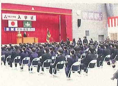
新体育館での令和4年度入学式風景（令和4年4月8日）